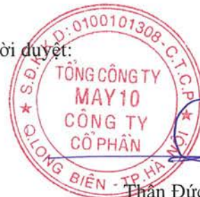
Thần Đức Việt Tổng Giám đốc

Các thuyết minh đính kèm là bộ phận hợp thành của báo cáo tài chính riêng giữa niên độ này